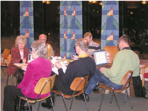
Det var mange ivrige og engasjerte tilhørere.