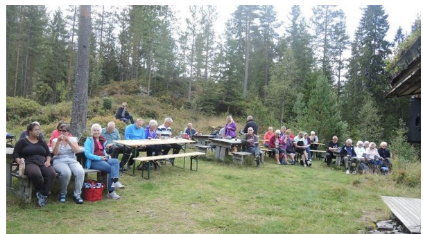
Benkene fylles når klokken nærmer seg 1200.