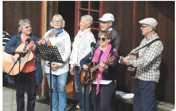
Sangsekstetten fra Salemkirken Lørenskog

Det ble solgt pølser m. tilbehør, kaffe og vafler, også den tradisjonelle naturstien med 4 oppgaveposter og 5 deltagerlag ble gjennomført før avslutningen presis kl 1500. Hjertelig takk til alle som møtte opp og som bidro til et godt stevne.