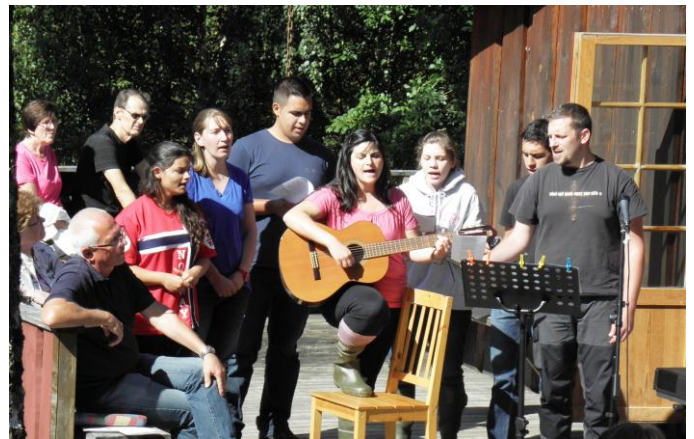
RETO er en sangglad gjeng og bidro med et par friske sanger.

Fra deres hjemmeside ( www.retonorge.no ) sakser vi følgende: