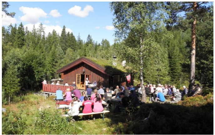
Blåbærstevnet ble en flott dag, bare noen små «godsnyer» å se på himmelen. Det var nær 60 fremmøtte som fikk høre god sang og forkynnelse.

Stiftelsen RETO er blitt til stor velsignelse for stua og de passer godt inn i å oppfylle dette punktet i våre vedtekter. De har søndagsvaktene gjennomsnittlig 1 gang pr mnd. og benytter stua også utenom dette.