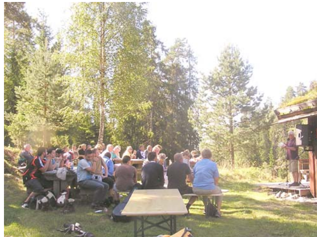
Kl 1200 var det folk ved benker og bord, men det var plass til flere og de kom etter hvert.