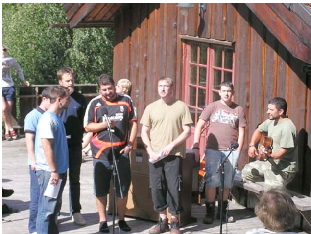
Gruppen fra Reto hilste oss med bl.a. et par sanger.