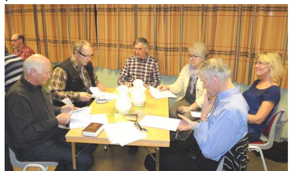
Ovenfor ser vi noen av deltagerne på årsmøtet