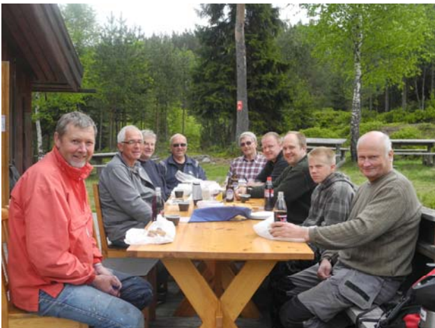
Uten mat og drikke ....., her tar dugnadsgjengen seg en matpause på verandaen. Ingen sure miner å se der nei.