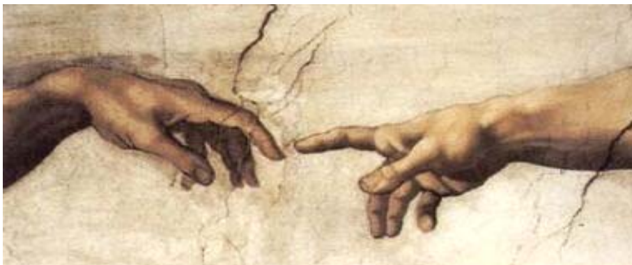
En detalj fra takmaleriet "Adams skapelse" av Michelangelo i det sixtinske kapell i Roma.

Info-organ for Stiftelsen Setertjernkapellet Rehabilitering Juni 2011