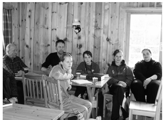
Både unge og eldre lytter til dagens budskap.