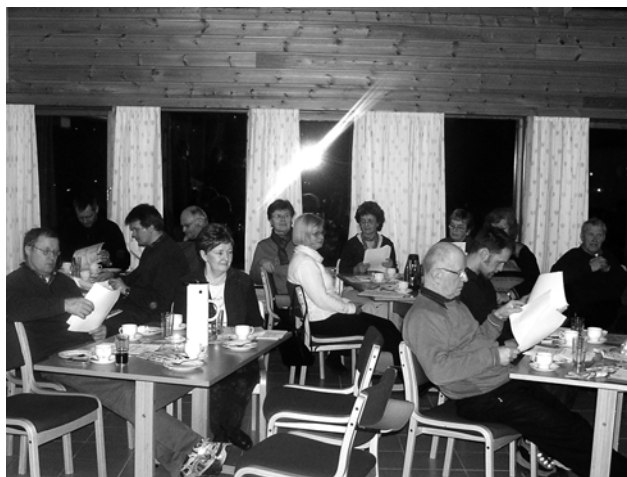
En del av forsamlingen, årsmøtepapirene studeres.

Mange andaktsholdere fra diverse menigheter har deltatt, tusen takk til dere alle. Også personer som har hatt ansvaret for de praktiske gjøremål på søndagene fortjener en stor takk, det er mye som skal ordnes med for at gjestene skal få det hyggelig og trives. Det er fremdeles folk innom så å si hver helg som er der for første gang, og alle besøkende gir uttrykk for trivsel og hygge, dette fremgår også av gjesteboken.